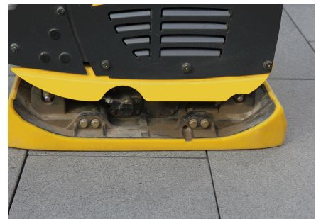
Große Aufstandsfläche für Großformate