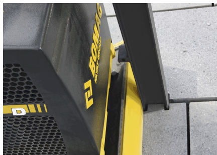
Keine Beschädigungen an Einbauten und Rändern